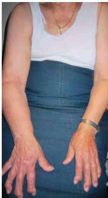
Photo 1b : Lymphœdème installé sans atteinte de la main