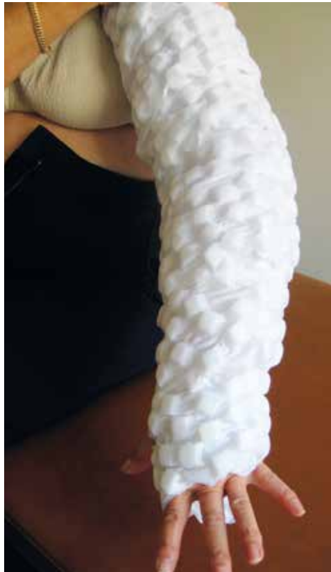
Photo 3c : Bande de type Mobiderm TM avant son recouvrement. Les plots de mousse permettant d'augmenter ponctuellement la pression