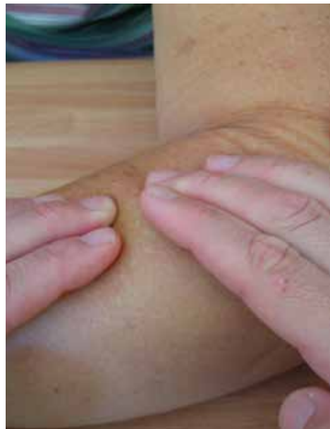
Photo 2c : Drainage manuel pulpaire d'une zone dure de l'avant-bras