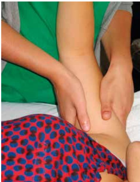
Photo 2b : Drainage manuel du bras